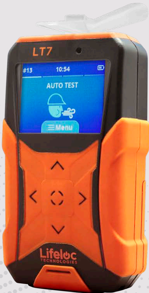
No se muestra en tamaño real