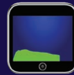
Gráfico de flujo de aliento

A medida que el sujeto sopla en la boquilla, el LT7 mostrará un gráfico del flujo de la respiración en la pantalla.